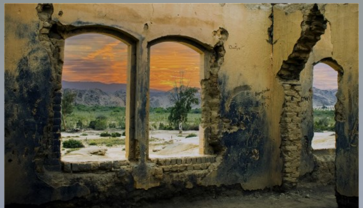
Deur die venster-Lizelle