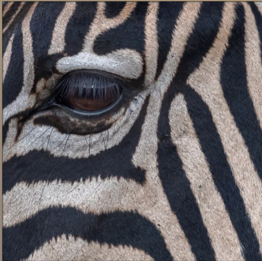
Lines and curves - Hennie Louw

'n Naby opname van 'n dier se oog/A close-up study of a animals eye.