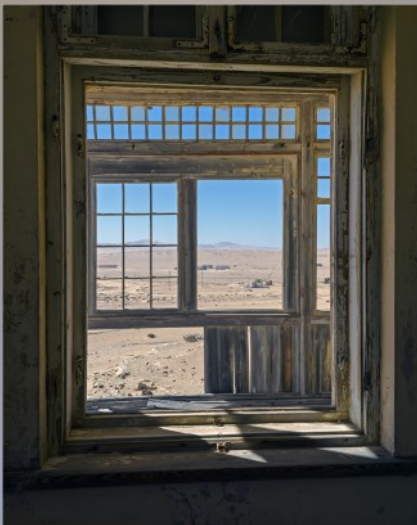
Desert Window-Retha Stegmann

Find your window view. Take a photo of any topic while looking through any window. The window is used as a frame and adds to the depth, mood and sometimes reflections of your image.