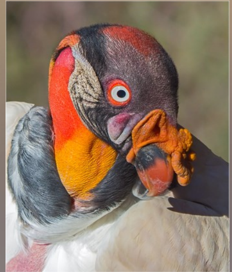
Ek watch jou - Dorette Nel